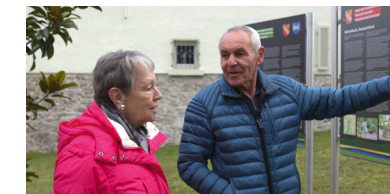
Partnerschaften erhalten, Freundschaften stärken – Pflege der Beziehungen zu unseren Partnergemeinden Tricarico (Italien) und Saint Philbert de Grand Lieu (Frankreich)