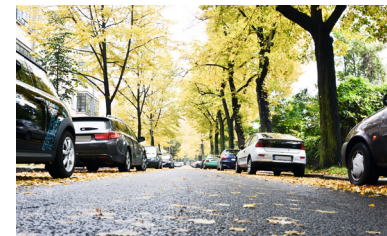
Mehr Sicherheit für alle Verkehrsteilnehmer – Den ruhenden und fließenden Verkehr ordnen

Unsere Verkehrspolitik: Sicherheit für alle Verkehrsteilnehmer, Ordnung und Überwachung des ruhenden und fließenden Verkehrs. All das wäre längst möglich und bedarf zunächst keiner ganzheitlichen Verkehrskonzepte für eine Viertelmillion Euro. Vorhandene Möglichkeiten ausschöpfen und Handlungsfähigkeit beweisen, darin sehen wir den Schlüssel zu geordneten Verkehrsverhältnissen in Bickenbach.