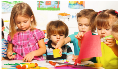
Familienfreundliches Bickenbach – Kinderbetreuung auf hohem Niveau erhalten und bedarfsgerecht weiterentwickeln