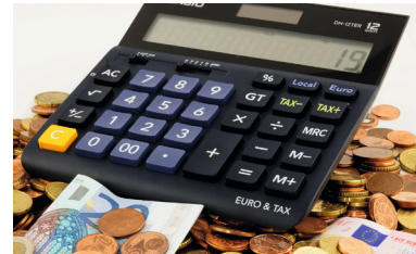
Solide Haushaltspolitik für Bickenbach – Verantwortungsvoller Umgang mit Steuergeldern

Eine solide, verlässliche Haushaltspolitik und einen verantwortungsvollen Umgang mit Steuergeldern fordern auch Andere. Unter dem Strich aber bleibt festzuhalten: Die Grundsteuer B wurde seit 2017 um sage und schreibe 62,5 % erhöht. Das einzig Verlässliche war die jährliche Steigerung der Hebesätze. Unser Grundsatz bleibt: Wir geben nur das Geld aus, das wir haben, und investieren mit Augenmaß. Man kann nicht nur an der falschen Stelle sparen, sondern auch an der falschen Stelle Geld ausgeben. Eine solide Haushaltspolitik gab und gibt es nur mit einer starken CDU.