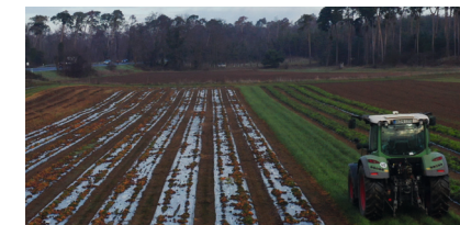
Kurze Wege, frische Produkte – Direktvermarktung landwirtschaftlicher Erzeugnisse stärken

Wir wollen Gewerbe und Wirtschaft in Bickenbach stärken: durch die Ausweisung neuer Gewerbeflächen, deren gezielte Vergabe an Unternehmen und den Ausbau der Wirtschaftsförderung. Symbolische Konjunkturprogramme wie die einmalige Zahlung von 500 Euro an Ausbildungsbetriebe, Wegweiser zu Gewerbetreibenden und Geschenke der Gemeinde in Form von Sandhasen sind zu wenig. Gewerbeentwicklung und Wirtschaftsförderung sollten wieder Chefsache im Rathaus werden.