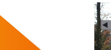
Eine Grillhütte für Bickenbach – Ein Platz zum Feiern für alle