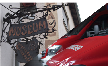
Das Rückgrat unserer Gemeinschaft – Vereine und Ehrenamt in Bickenbach weiter unterstützen