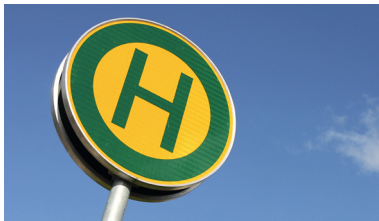
Öffentlichen Personen-Nahverkehr (ÖPNV) stärken – Busdirektverbindung nach Bensheim und flexible Beförderungsangebote schaffen