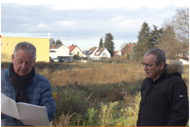
Ortsmitte wiederbeleben – Bebauung zügig umsetzen

Wir unterstützen eine zügige Bebauung der Ortsmitte, um die Brache im Herzen unserer Gemeinde endlich wieder mit Leben zu füllen. Das Projekt kam bislang nicht voran, weil juristisch gegen das Verfahren vorgegangen wurde. Das ist legitim; nicht legitim ist dann der Vorwurf, dass es nicht vorangeht. Wer sich über das Vorhaben informieren möchte, kann dies im Ratsinformationssystem der Gemeinde umfassend tun, über das Verfahren wird und wurde regelmäßig berichtet. Es haben auch – ganz abgesehen von den Gemeindevertretungs- und Ausschusssitzungen – öffentliche Informationsveranstaltungen stattgefunden. Die Pläne liegen auf dem Tisch, wir wollen sie umsetzen.