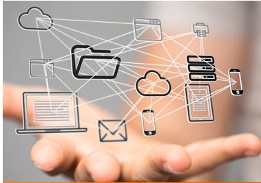
Digitalisierung der Verwaltung – Das digitale Rathaus steht für Bürgerfreundlichkeit