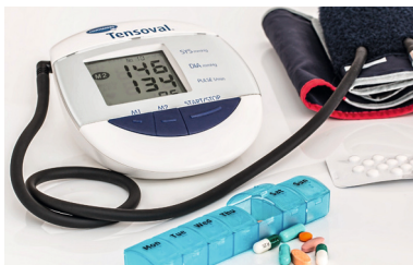
Ärztliche Versorgung in Bickenbach sicherstellen