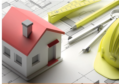
Neue Flächen für Wohnraum – Planung des Baugebietes „Bachgewann“ vorantreiben