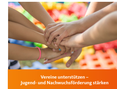
Vereine unterstützen – Jugend- und Nachwuchsförderung stärken