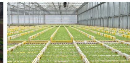
Ausweisung neuer Flächen für Gewerbe – Gezielte Ansiedlung von Unternehmen in Bickenbach