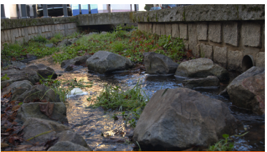
Damit es wieder läuft: Bachlauf pflegen – Unsere Bachgasse wieder attraktiv machen