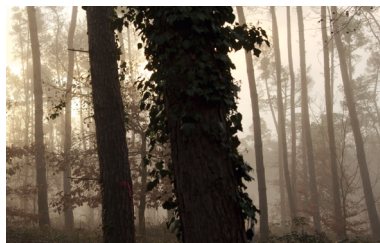
Unser Bickenbacher Wald – Naherholung, Waldwirtschaft und Klimaschutz sind kein Widerspruch