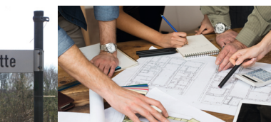
Eine Grillhütte für Bickenbach – Ein Platz zum Feiern für alle