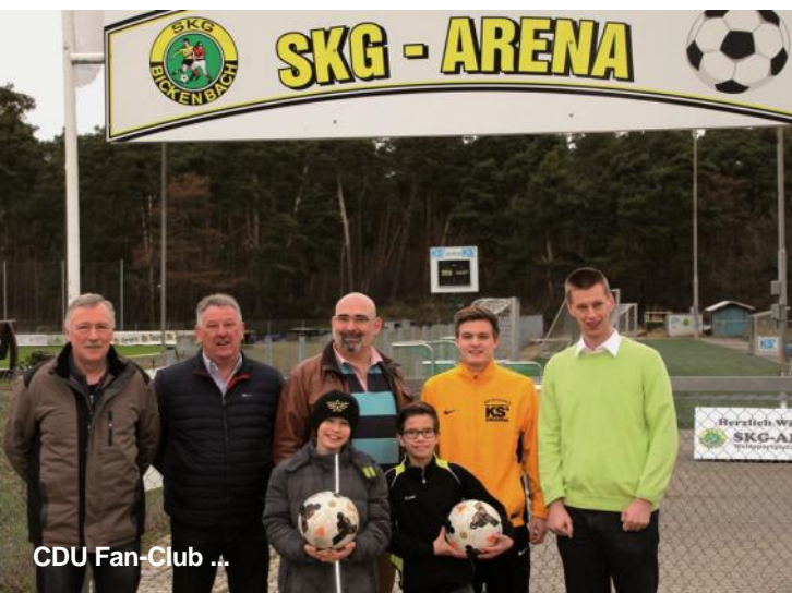
CDU Fan-Club ...

Wir unterstützen ausdrücklich das Engagement der Hans-Quick-Schule und setzen uns mit allen Mitteln dafür ein, dass dieses Projekt bereits im Sommer 2016 starten kann. □