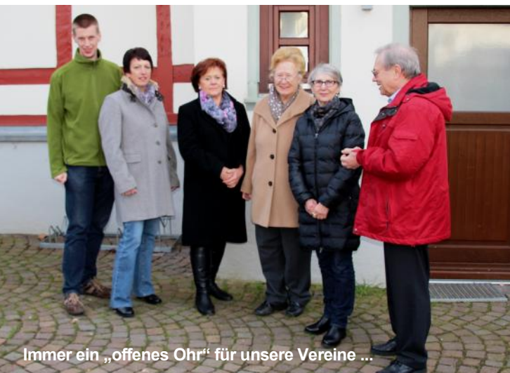
Immer ein „offenes Ohr“ für unsere Vereine ...

Wir sagen an dieser Stelle allen Bickenbacher Ehrenamtlichen ein herzliches DANKE! □