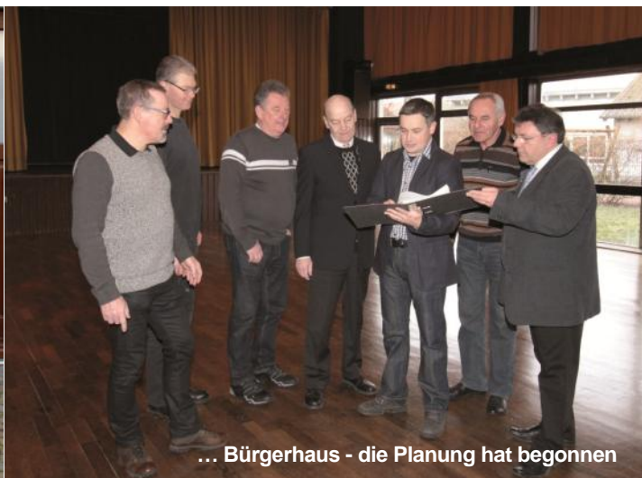
... Bürgerhaus - die Planung hat begonnen