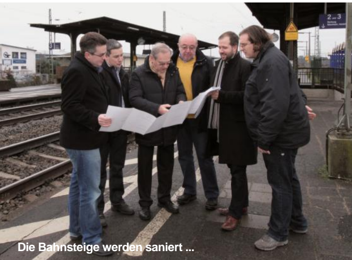
Die Bahnsteige werden saniert ...

Unter dem Begriff Infrastruktur verstehen wir auch die Entwicklung der Außengemarkung. Insbesondere die Erhaltung unseres Gemeindewaldes in seiner Funktion als „ Naherholungsgebiet vor der Haustür “ liegt uns hier sehr am Herzen. Hierzu gehören in erster Linie standortgerechte Aufforstungen und Pflege im Rahmen eines nachhaltigen Forstentwicklungsplanes , aber auch die Sanierung der Wald- und Feldwege. □