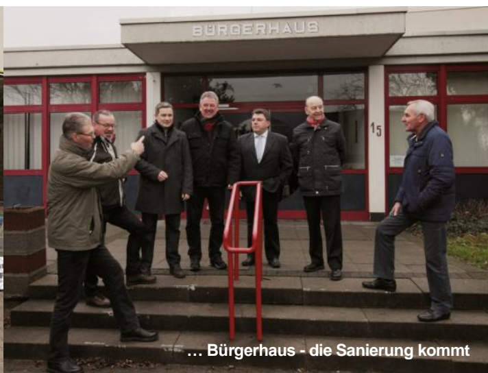
... Bürgerhaus - die Sanierung kommt