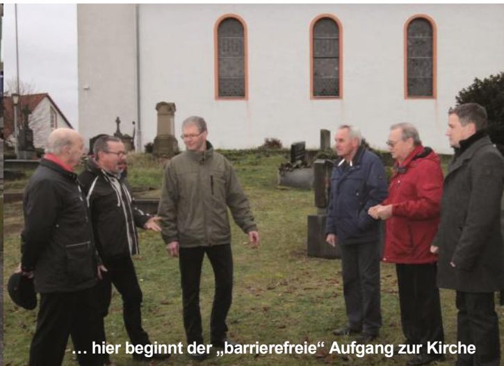
... hier beginnt der „barrierefreie“ Aufgang zur Kirche