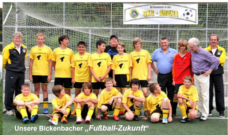
Unsere Bickenbacher „Fußball-Zukunft“