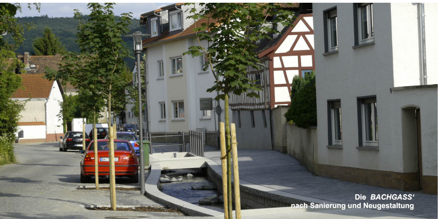
Die BACHGASS' nach Sanierung und Neugestaltung