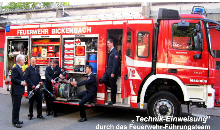
„ Technik-Einweisung “ durch das Feuerwehr-Führungsteam