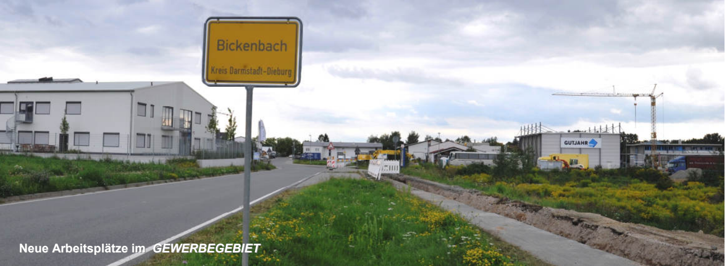
Neue Arbeitsplätze im GEWERBEGEBIET