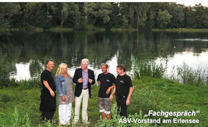
„Fachgespräch“ ASV-Vorstand am Erlensee